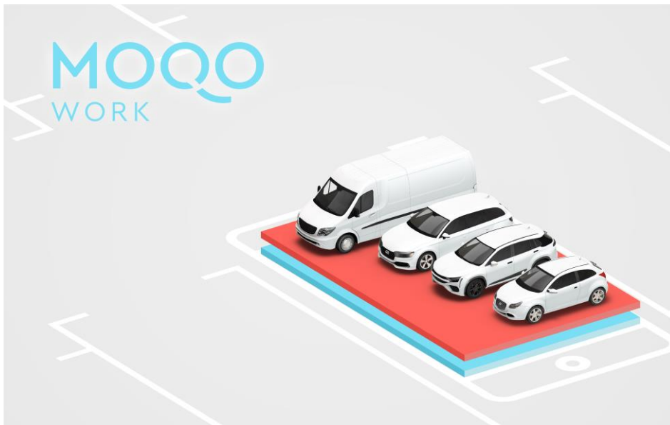
Bild 2: Mit der App MOQO WORK können Firmen ihren Mobilitätsservice managen