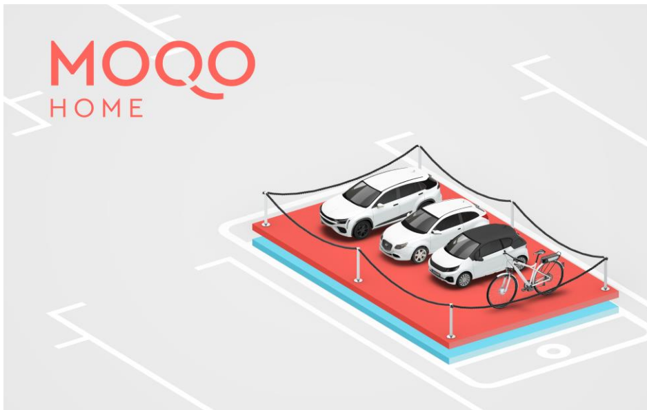
Bild 1: Die App MOQO HOME bildet den Mobilitätsservice für Wohnanlagen ab; Bildquelle: MOQO